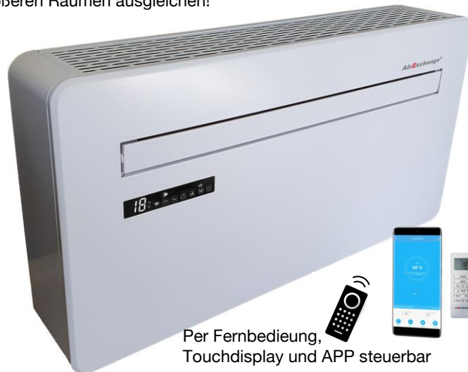
Per Fernbedienung, Touchdisplay und APP steuerbar

Darüber hinaus sorgt der eingebaute Filter dafür, dass Schadstoffe wie Viren, Bakterien, Pollen, Staub, Krankheitserreger, Allergene und chemische Verbindungen entfernt werden, mit einer Wirksamkeit von mehr als 70 % !